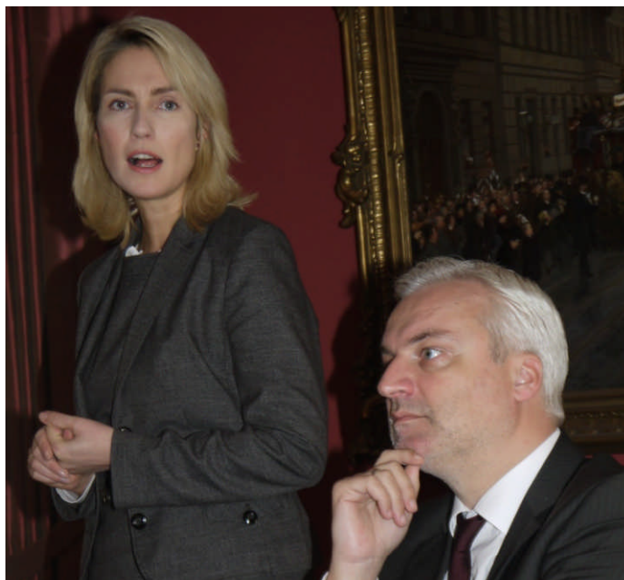
„Familienland Deutschland“ - in der SPD steht die stellvertretende Parteivorsitzende und Arbeits- und Sozialministerin von Mecklenburg-Vorpommern, Manuela Schwesig, für dieses Ziel. Hier mit Garrelt Duin als Diskussionsleiter.

Ein weiterer Schwerpunkt des Familienprogramms wird die Verbesserung der Pflege sein.