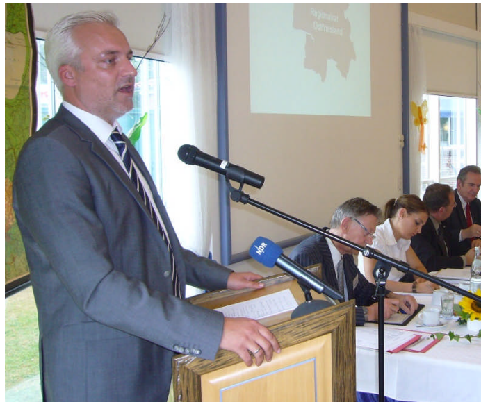
Die Region stärken: Konstituierende Regionalratssitzung in Aurich

Die Diskussion über die Einrichtung des Regionalrates wurde über mehrere Jahre geführt und fand mit der Konstituierung ihr gutes Ende. Dem Gremium gehören insgesamt 53 Vertreter der Kreistage der Landkreise Aurich, Leer und Wittmund sowie des