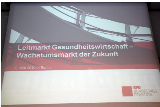
Wichtiger Leitmarkt der Zukunft: die Gesundheitswirtschaft.

Wichtig ist der SPD-Bundestagsfraktion hierbei, wirtschaftliche Belange in Einklang mit den Prinzipien guter Arbeit, einer nachhaltigen Entwicklung und einer solidarischen Ausrichtung des Gesundheitssystems insgesamt zu bringen. Wir wollen, dass sich die Gesundheitswirtschaft gerade jetzt zum Leitmarkt der Zukunft weiterentwickelt und so zum wichtigen Motor für neues und qualitatives Wachstum in unserem Land wird.