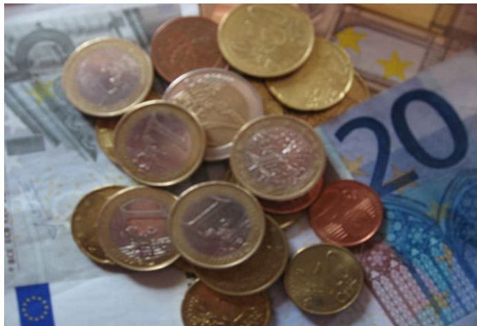
Griechenland-Hilfe: die Kostenrisiken können nicht allein auf die Steuerzahler abgewälzt werden.

Wir müssen verhindern, dass ein ums andere Mal die Steuerzahler zur Kasse gebeten, die Spekulanten aber belohnt werden. Die SPD fordert: