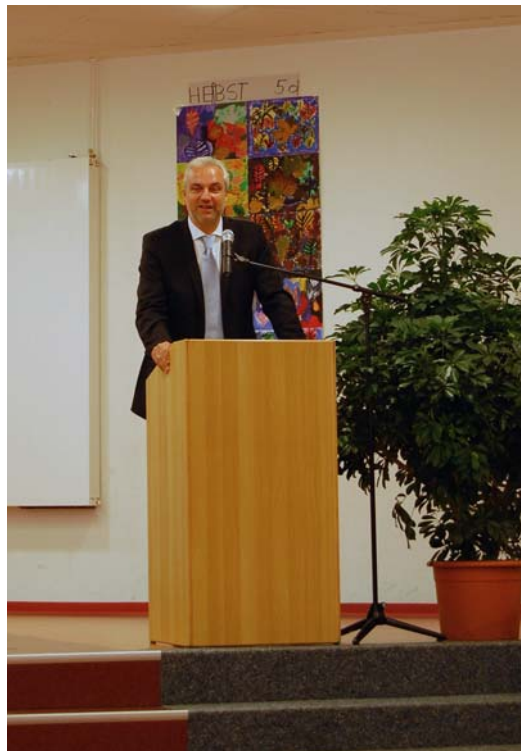
Garrelt Duin sprach das Grußwort auf der Einweihung der Hermann-Tempel-Gesamtschule in Ihlow.

Seit Juni 2005 ist die Gesamtschule, die derzeit rund 650 Kinder aus der Gemeinde Ihlow sowie aus dem Auricher Bereich besuchen, auch Ganztagschule. Mit der Fertigstellung der Mensa ist die HTG jetzt komplett ausgestattet. Neben der Mensa wurden seit 2003 ein Unterrichtsgebäude mit 20 allgemeinen Unterrichtsräumen, ein Werktrakt, ein zentrales Freizeit- und Veranstaltungsgebäude sowie ein Fachunterrichtsgebäude gebaut. Die Gesamtkosten beliefen sich auf rund 7,9 Mio. Euro. Aus dem Investitionspro-