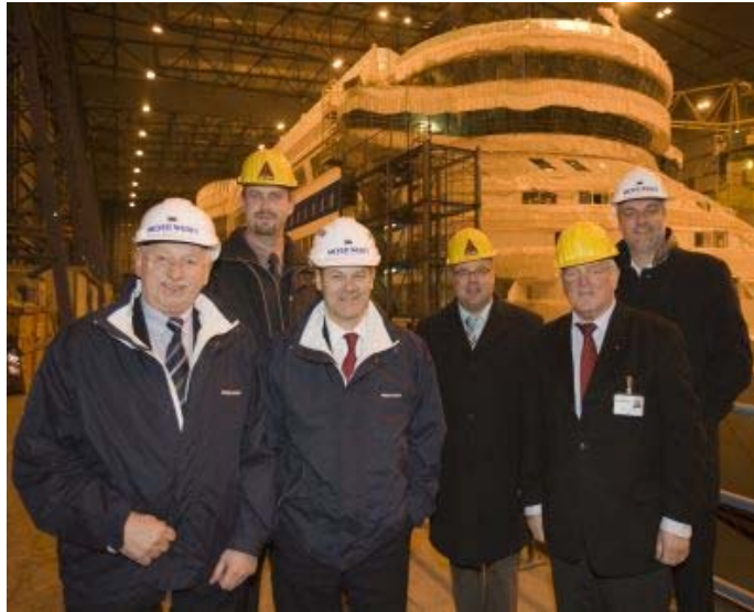
Bundesarbeitsminister Olaf Scholz besichtigte die Meyer-Werft.

In dem Gespräch mit der Geschäftsleitung und dem Betriebsrat der Werft ging es neben der aktuellen Finanzkrise und den damit verbundenen Auftragsstornierungen (auch bei deutschen Werften) um die Sozial- und Arbeitsmarktpolitik in einer flexiblen Arbeitswelt. Der aktuelle Tarifabschluss in der Metall- und Elektrobranche sowie die Themen Altersteilzeit, Rente mit 67, Arbeitszeitkonten und die Mitarbeiterkapitalbeteiligung und