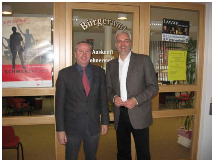
Bürgermeister Theo Weber und Garrelt Duin vor dem Eingang zum Bürgerbüro und Touristinformation im Großheider Rathaus.

Er forderte Korrekturen und sagte: „Jede Gemeinde, die eine Gesamtschule einrichten möchte, muss auch die Möglichkeit bekommen, denn es geht um die Verbesserung der Bildungschancen der Kinder. Die 5-Zügigkeit muss fallen.“